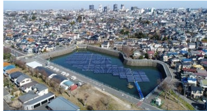
フロートソーラー所沢 385kW