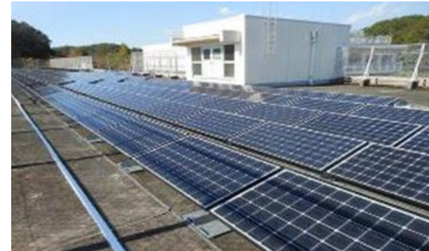
小中学校屋根貸し 太陽光発電事業