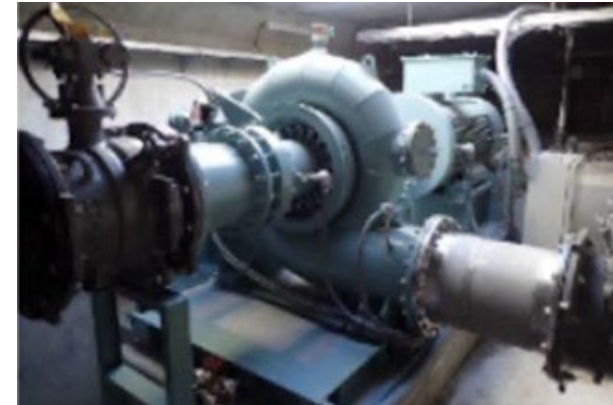
浄水場 小水力発電