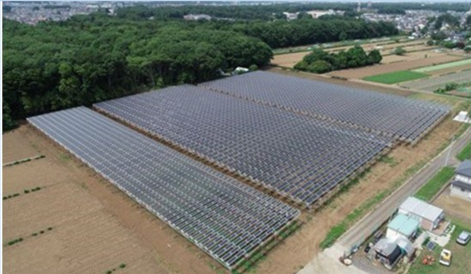
民官連携ソーラーシェアリング 989kW