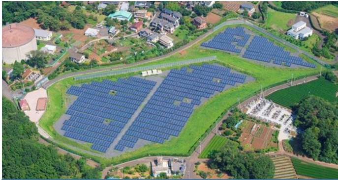
メガソーラー所沢 1,053kW