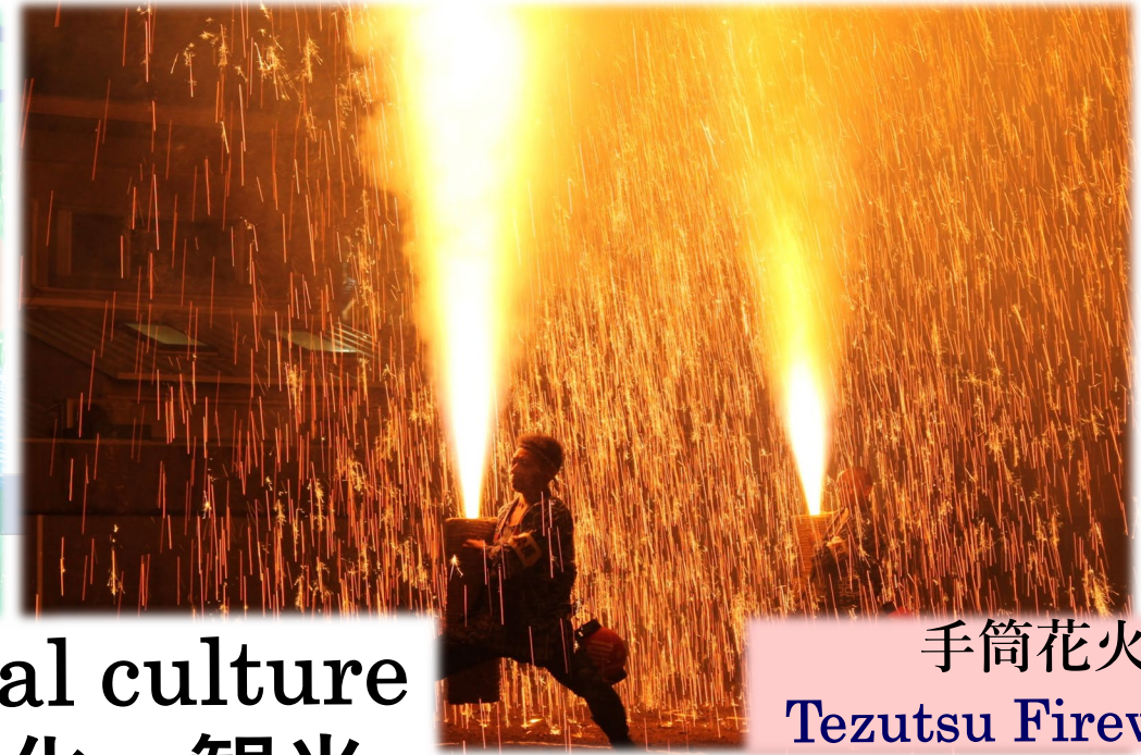
手筒花火 Tezutsu Fireworks