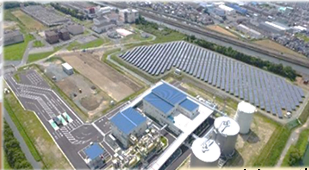
バイオマス発電 Biomass power