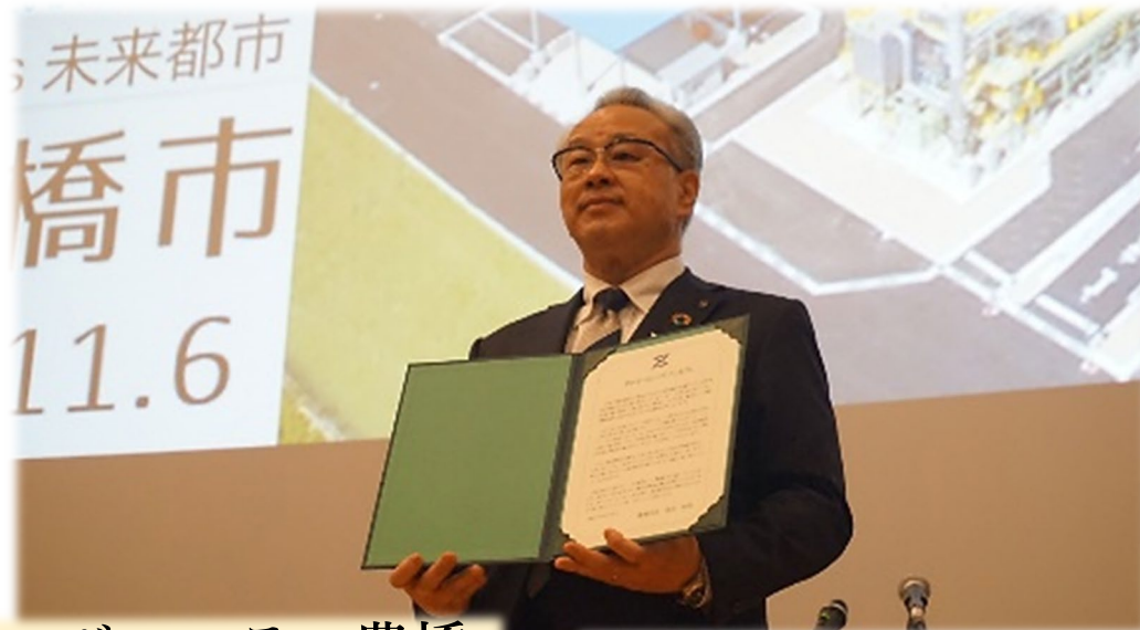
ゼロカーボンシティ豊橋 Zero-carbon city