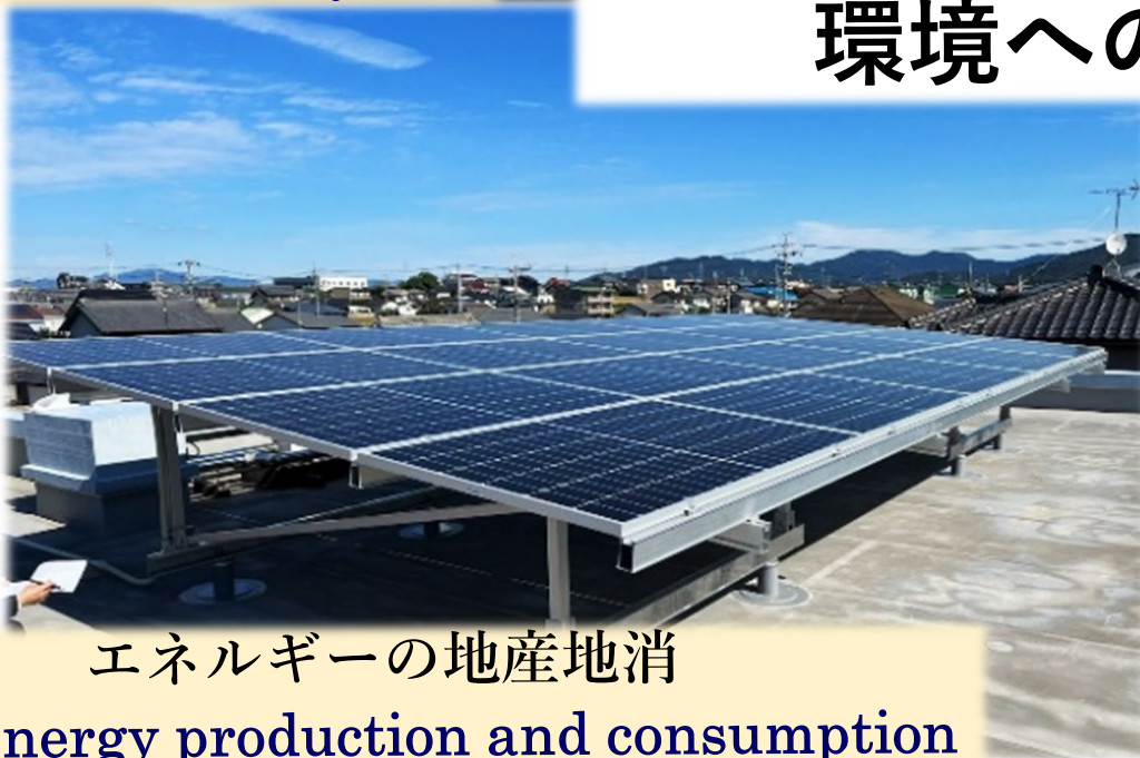
エネルギーの地産地消 Local energy production and consumption